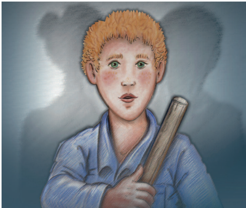
Poil de Carotte - Dijon